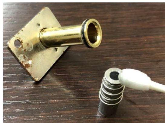
シャフト外側の Oリング